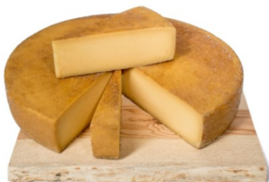
Taurus Horský sýr

V této kategorii soutěžilo 8 výrobků od 5 společností a do finále postoupily tyto 3 výrobky: