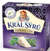
Kráľ sýrů Hermelín provensálské bylinky