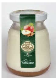
Jogurt La Formaggeria jablko se skořicí