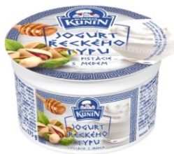
KUNÍN – jogurt řeckého typu pistácie s medem

V této kategorii nejpočetněji obsazené soutěžilo 13 výrobků z 5 společností a do finále postoupily tyto 3 výrobky: