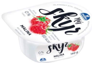
Milko Můj Skyr - malina