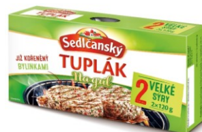
Sedlčanský Tuplák na gril s bylinkami