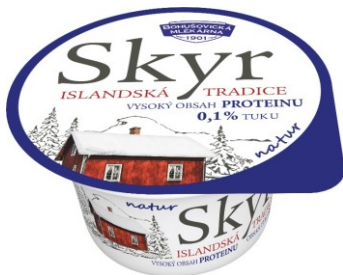
Skyr – zakysaný mléčný výrobek - natur

V této nové kategorii soutěžilo 7 výrobků ze 2 společností a do finále postoupily tyto 2 výrobky: