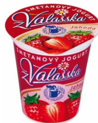
Smetanový jogurt z Valašska - jahoda